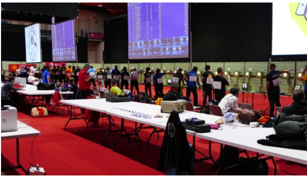
La Salle du Dôme à Carcassonne