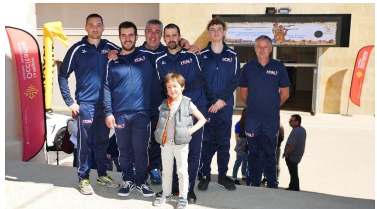
La fine équipe !