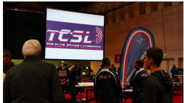
Le TCSL !