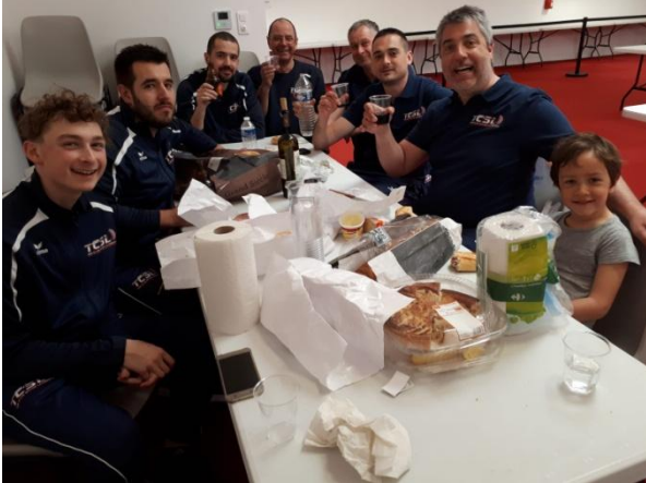
Dans la bonne humeur !