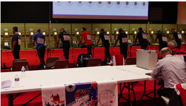
Les quarts de finales