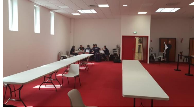
Une salle rien que pour nous !